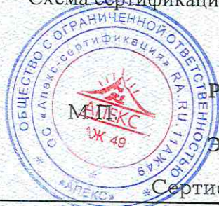
Схема сертификации: 1с.